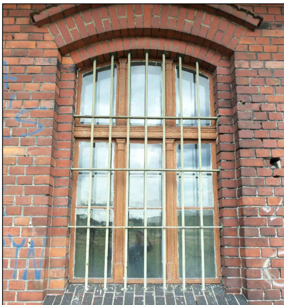
OKNO ISTNIEJĄCE "ok4" CZĘŚĆ WSCHODNIA BUDYNKU