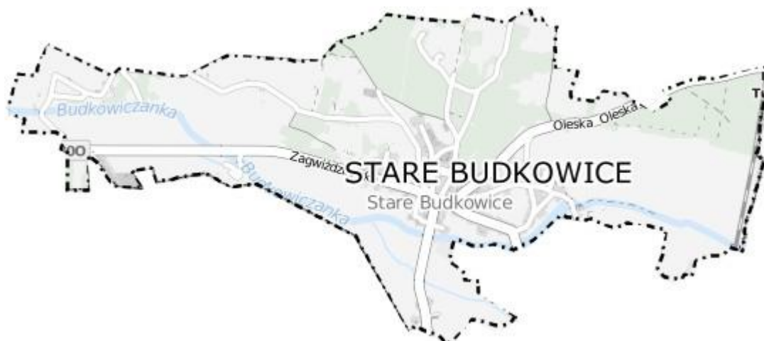
Mapa 2. Stare Budkowice