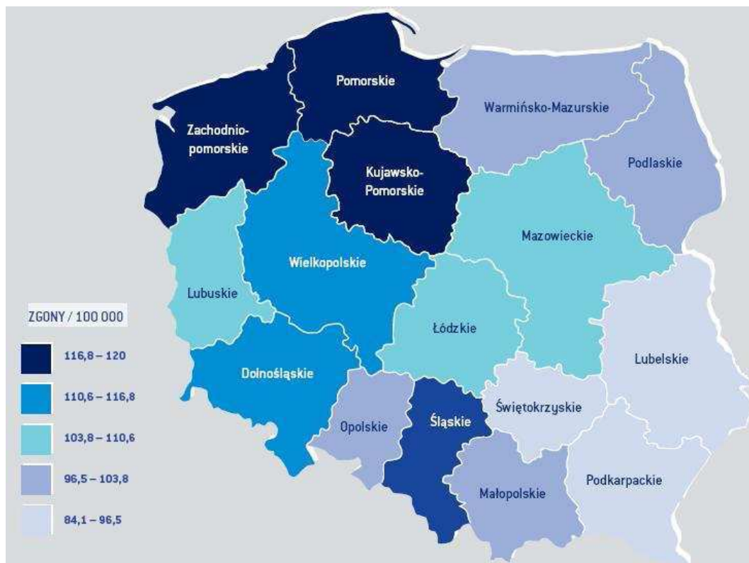
Rycina nr 1. Rozkład geograficzny umieralności na nowotwory złośliwe.